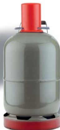
5 kg Nutzungsflasche