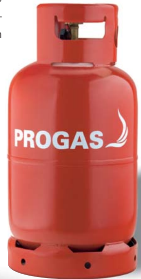
11 kg Staplergasflasche

Ob gelegentliche Anwendung oder regelmäßiger Einsatz, ob private oder gewerbliche Nutzer: PROGAS hat für jede Kundengruppe die richtige Propangasflasche im Angebot. Neben den Standardflaschen mit 5, 11 und 33 kg Füllmenge liefern wir Staplergas in 11-kg-Flaschen.