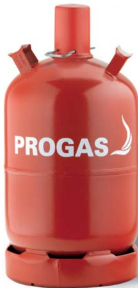
11 kg Pfandflasche