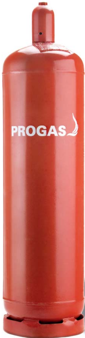
33 kg Pfandflasche