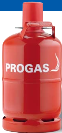
5 kg Pfandflasche