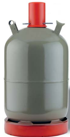
11 kg Nutzungsflasche